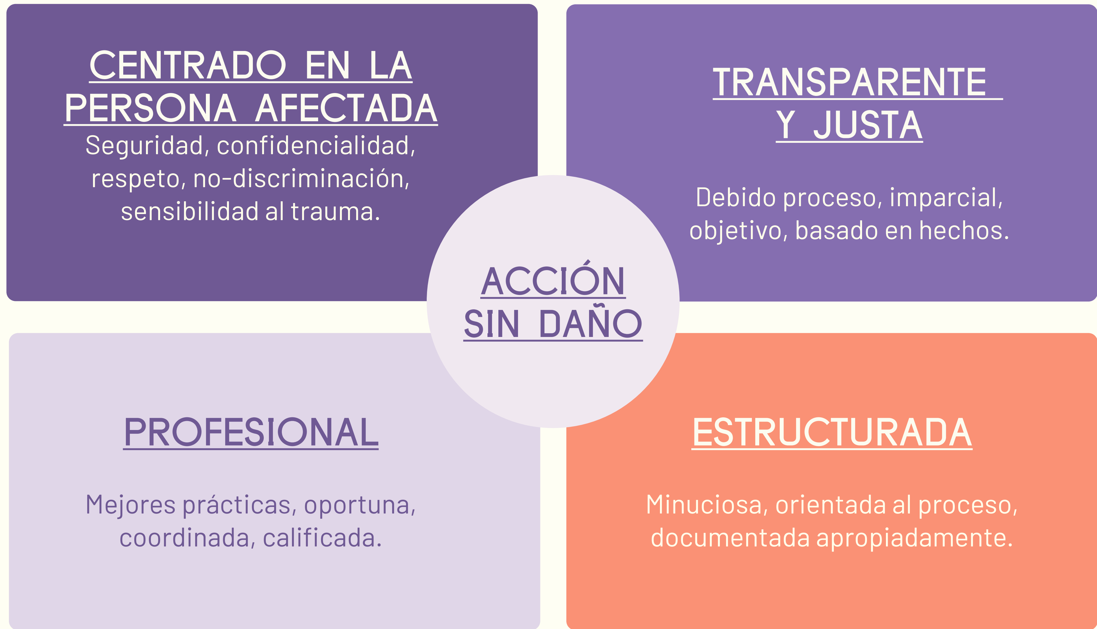
Figura 2: Principios de gestión de casos e investigaciones de salvaguardia. Adaptado de CHS Alliance y Humentum.